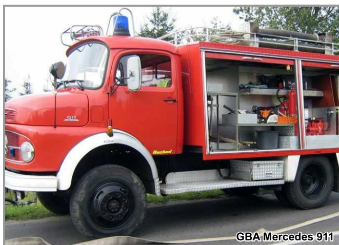
GBA Mercedes 911

Lekki samochód SLKw Mercedes 308 (rok produkcji 1981), został sprzedany OSP w Oławie za 5000zł.