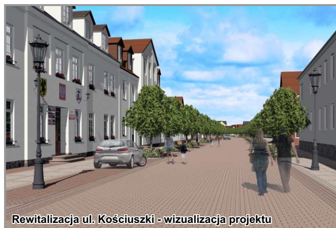
Rewitalizacja ul. Kościuszki - wizualizacja projektu

W zależności od realizowanych etapów wprowadzane są zmiany w organizacji ruchu. Prosimy o uwagę, cierpliwość i zrozumienie. Obecnie ruch drogowy odbywa się połową jezdni.